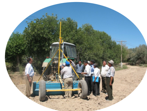
Хоразм Агро-маслаҳат маркази