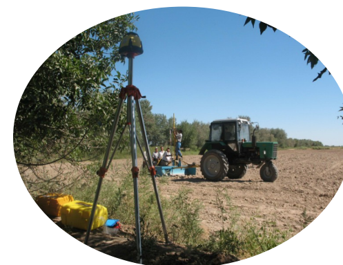
Урганч - 2009