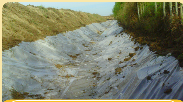
3 - расм. Плёнка солиш