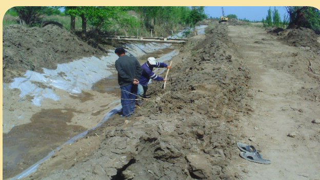
4 - расм. Тупроқ солиш