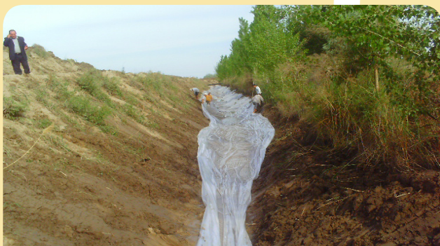
2 - расм. Плёнка солиш