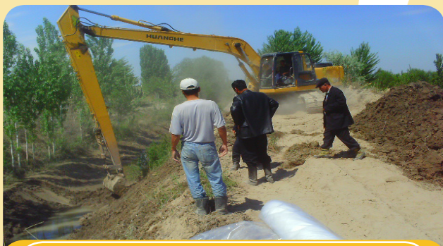
1 - расм. Канални тозалаш

Плёнка солишдан олдин “Наврўз-яп” каналининг туби ва ёнлари шундай тайёрланганки, суғориладиган далаларга сувнинг ўзи оқиб тушиши таъминлансин.