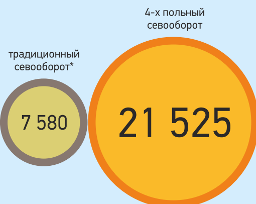
Средняя продуктивность при традиционном 4-х польном севообороте с 1 га, к.е.