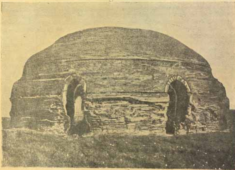
3. Яккасардоба в Голодной степи

сейна, затем часть (пустыни) Хумейда, затем Винкерд, затем Шутуркет. 44 В одной из рукописей Махдиси приводится этот же дорожник, но в обратном направлении от Шутуркета к Джизаку. 45 Шутуркет лежал на правом берегу Чирчика. Селение Винкерд, жители которого в X веке были христианами, по В. В. Бартольду, могло находиться на левом берегу Сырдарьи, 46 тогда как В. Л. Вяткин хотел искать его на левом берегу Чирчика, значительно дальше устья. 47 Принимая во внимание показание Ибн Хаукаля, мне ду-