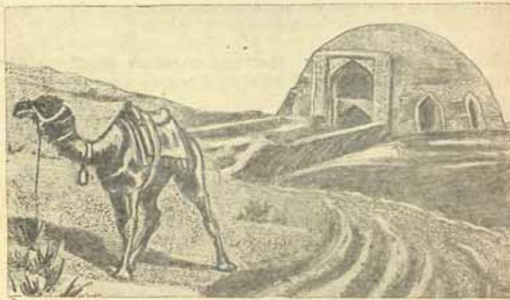
1. Сардоба Каршинской степи По зарисовке Б. Литвинова в 1898 г.