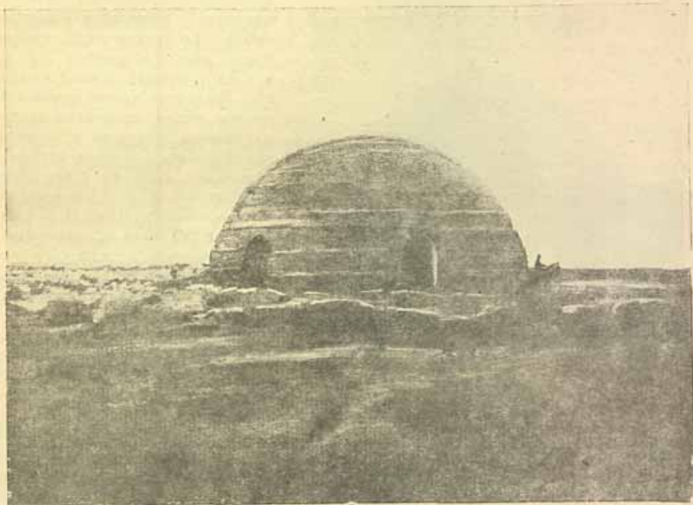
5. Яккасардоба в Каршинской степи.

По продолжению этой дороги, километрах в 28 в ЮВ направлении стоит Яккасардоба. Прекрасной сохранности купол ее имеет около 9 м. высоты, насчитывает семь отступающих внутрь кольцевых ярусов и прорезан, судя по имеющимся в моем распоряжении фото, четырьмя большими окнами и одним входным арочным пролетом. Диаметр ее цистерны—14 м., а глубина около 4 м. Сардоба приспособлена исключительно для сбора снеговых и дождевых вод, стекающих с полотна дороги. 100