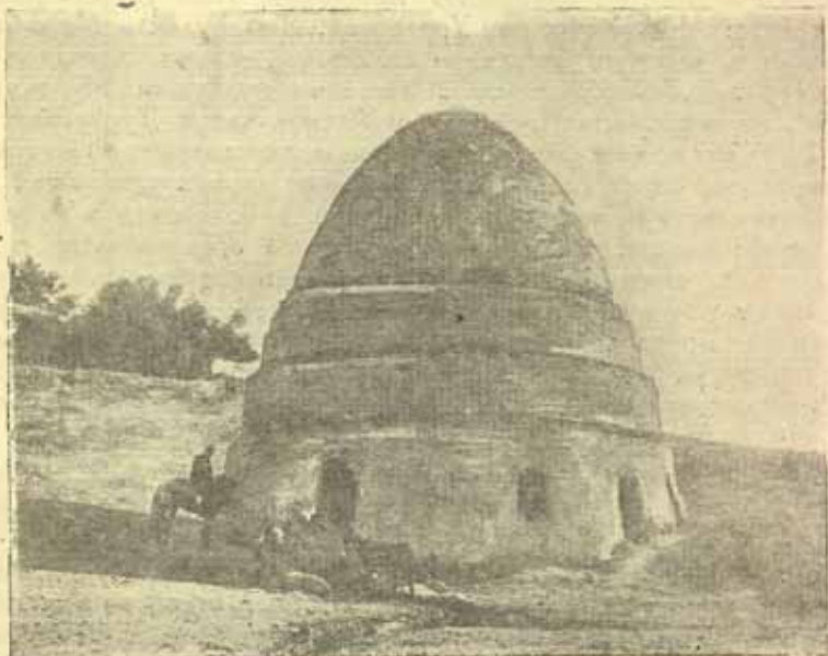
2. Гумбаз над источником в Кайнаре. Фото 1929 года.

высоты и, примерно, столько же в диаметре основания, которое сложено из крупных камней и образует собой почти целиком площадь неглубокого резервуара. Вода в нем подходит вплотную к стенам гумбаза. Выше самый купол сложен из жженого кирпича (размером 24 см. × 24 см. × 5 см.; 26 см. × 26 см. × 5 см. и 27 см. × 27 см. × 5 см.) на ганчхаке со швами от 1,5 см. до 2,5 см. Состоит он из трех ярусов отступающей внутрь кольцевой кладки, а с высоты