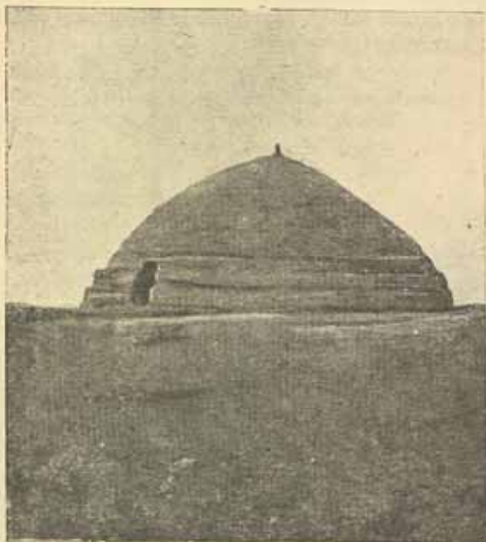
6. Сардоба Шахсувар в степи Уртачуль. Фото Н. И. Миронович 1930 года.

Первая сардоба на этом пути со стороны Бухары носит название Аккана и находится в таком состоянии, что ее давно уже именуют на картах развалинами.